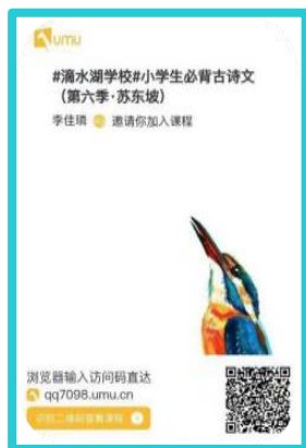
微课《走近苏东坡》（图 2）

历时四年的探索实践，我校利用“UMU 平台”研究开发了“小而美”的古诗词主题微课，坚持一假期一季，一季一个主题，在 2021 年的寒假，学生、老师在线上相会，聚焦主题微课《走近苏东坡》（见图 2），共同聆听苏轼诗词中的古风音韵，诗味故事。