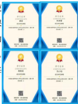
微课第六季“走近苏东坡” 学习证书（图 8）

3. 完善古诗词文化传承的“刻度”。近年来，随着课堂教学改革及教育评价改革的推进，在教学过程中注重过程性评价、诊断性评价已成为一线教师的共识。借助“umu 互动平台”，学习者学习的全过程数据得以保留，使得我们可以动态了解学习者状态。微课组教师为每一位学完全部必修课程的学员颁发在线“学习证书”（见图 8）。线上作业有了技术支持，给每个学生每个阶段的学习留下了学习的“刻度”，教师能够更客观、更科学地评价学生。