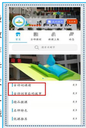
滴水湖学校智慧教育平台 古诗词诵读作品（图 3）

孩子们铿锵有力的音韵，让作业有了最动听的声音。主题微课的线上拓展作业，教师、家长都可以点击收看，并点评。这一作业形式实质上是让信息技术赋能学生的学习，不仅拓宽了学生学习的物理空间，激发学生对诗歌的深层理解，还让优秀的传统文化由课堂走向课外，如源源不断的活水，滋养少年儿童的文化之根。