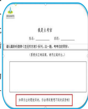
“我是主考官”题卡（图 4）

第三步，实现愿景，把学生的作业成果以考查卷形式呈现，每一道题目后都会注明此题的设计师。