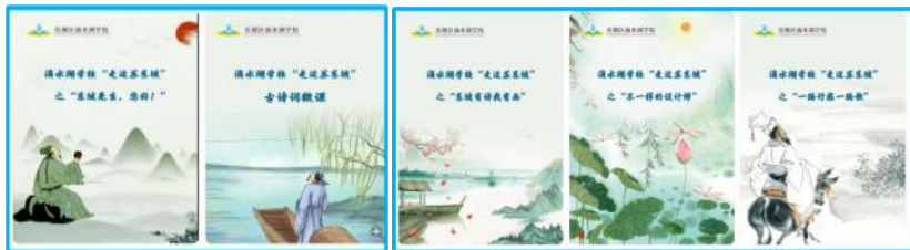
滴水湖学校“走近苏东坡”学生作业集（图 6）

孩子们在学习古诗的同时，了解诗人背景，设计身份证，为诗人的诗集、词集绘制大气、浩然的封面，一如他的作品，跟着诗歌去旅行，留下一幅幅行旅图，感悟东坡文化中的乐趣、意趣、志趣（见图 7）。