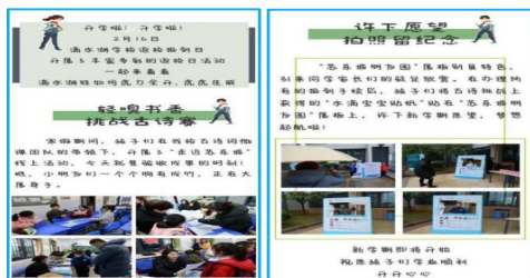
学校开学活动微信公众号宣传（图 5）