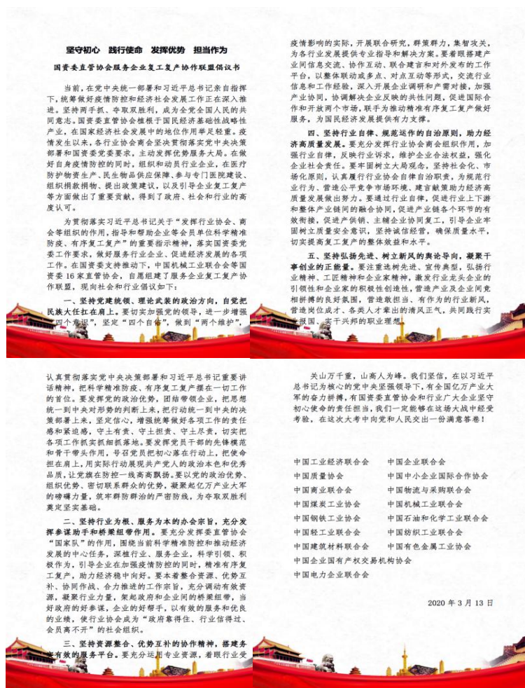
图2 国资委直管协会服务企业复工复产协作联盟倡议书