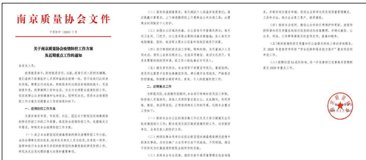
图3 南京质协疫情期间重点工作

六、实行线上办公。为有效减少人员聚集，阻断疫情传播，实行弹性工作制，采用在线办公模式，远程协同，进一步开发线上服务功能，转变工作方式。