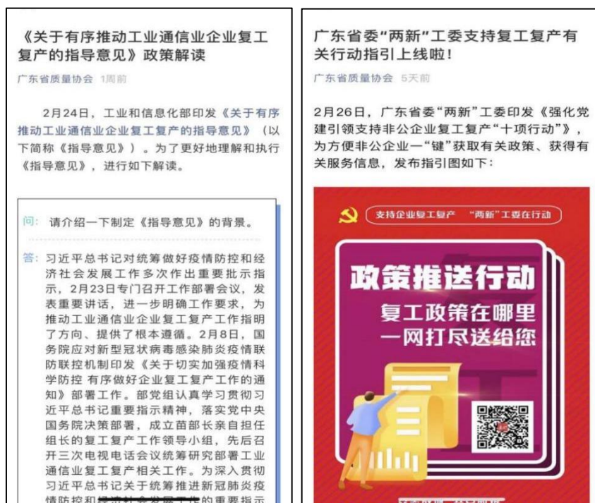
图2 广东质协及时发布复工指南、指导意见等政策

为帮助会员单位有序安全地复工复产，协会多方联系口罩等防疫物资生产厂家，解决燃眉之急，为早日恢复经营提供有力保障。利用微信公众号、官方网站以及会员群等平台，及时发布和推送复工指南、指导意见等内容，坚持发布关于疫情的最新政策、动态、健康科普、会员单位抗击疫情感人故事等，并发出了广东省科协《致全省广大科技工作者—请为疫情防控建言献策》活动通知，发动会员单位广大科技工作者对疫情防控工作建言献策，提出专业性意见和建议，为共同打赢疫情防控阻击战贡献力量。