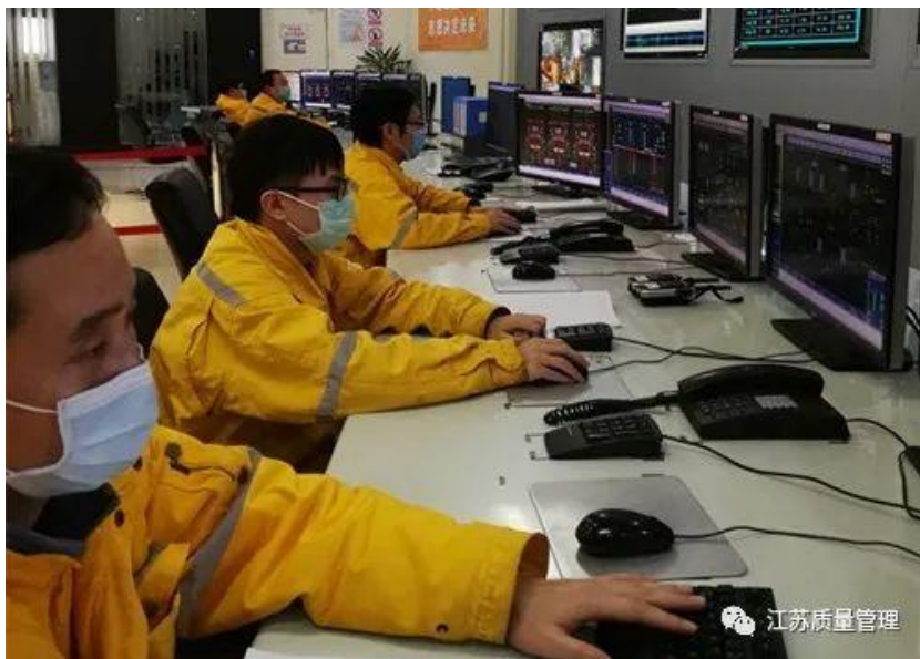
图 4 南京化学工业园热电公司员工奋战一线

治群控的强大合力，在完成公司自身防控工作的基础上，以稳定可靠的供电供热助力全社会打赢防疫阻击战。