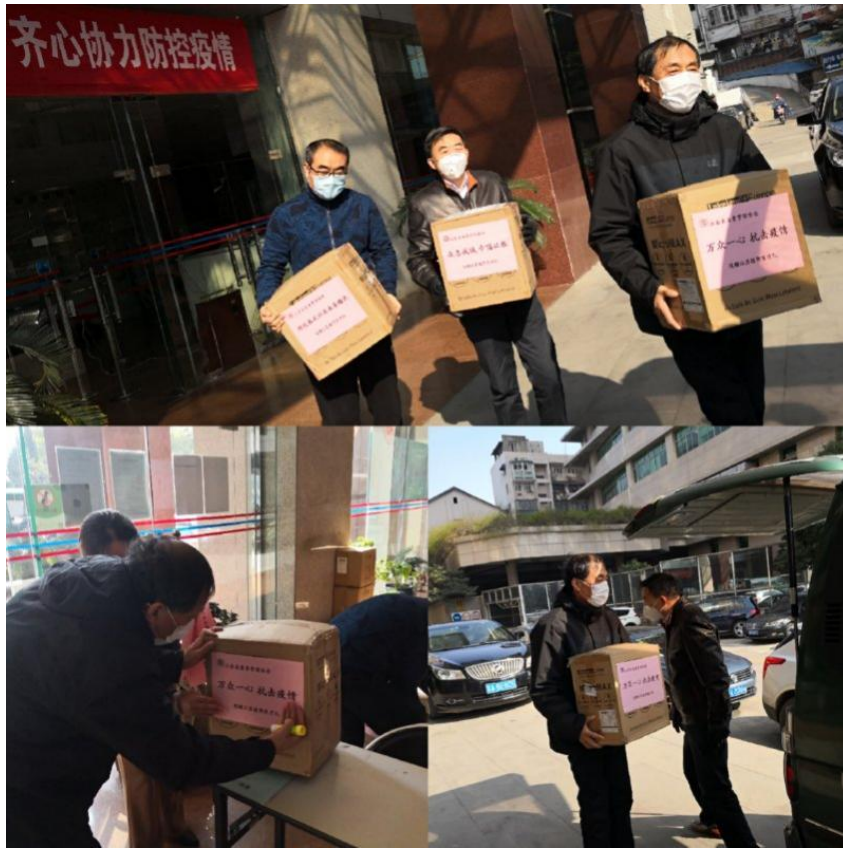
图2 江苏质协捐赠医用防护服驰援江苏援鄂医疗队