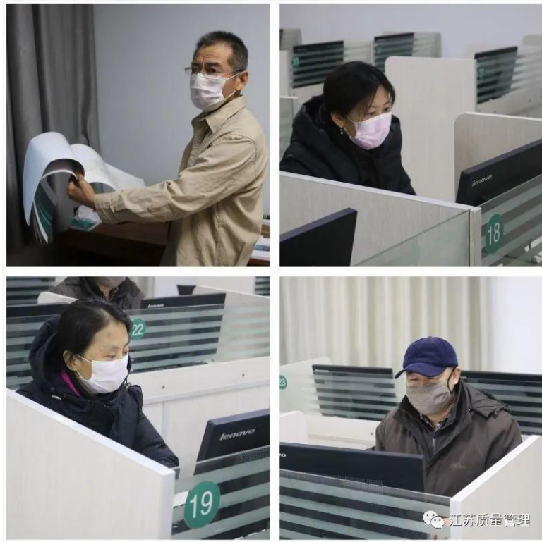
图3 徐州供电全力战“疫”保电

南京化学工业园热电公司： 在防控新冠肺炎疫情这个没有硝烟的战场上，南京化学工业园热电公司坚决贯彻落实上级的决策部署，积极开展防疫工作。公司成立了疫情防控领导和工作机制，确保防控工作落实到位，各党支部及全体党员以实际行动践行初心使命，各责任区党员们把做好疫情防控各项工作，作为检验政治觉悟和党性宗旨的重要战场，冲锋在前、迎难而上、无私奉献，坚守在疫情防控第一线，推动各项工作落实落细，凝聚起群防群