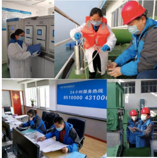
图3 荆州水务人全力保障市民用水

沙市钢管分公司： 疫情来临，沙市钢管分公司党委坚决贯彻落实上级党组织决策部署，成立了疫情防控工作应急领导小组，扎实开展各项防控工作。公司积极组织党员干部志愿者帮助做好社区疫情防控工作，开展线上培训讲座和EAP系列活动，引导员工掌握疫情防控科学知识、缓解焦虑恐慌心理、调整生活状态、提高自身免疫力，平安度过疫情焦虑期。公司将疫情防控作为最重要的工作抓紧抓好抓实，同时把各项生产经营工作与有效的疫情防控统筹起来，合理安排生产经营，优先安排重点项目资金，科学有序做好应急预案和应对准备，全力保障员工群众的生命安全和身体健康。