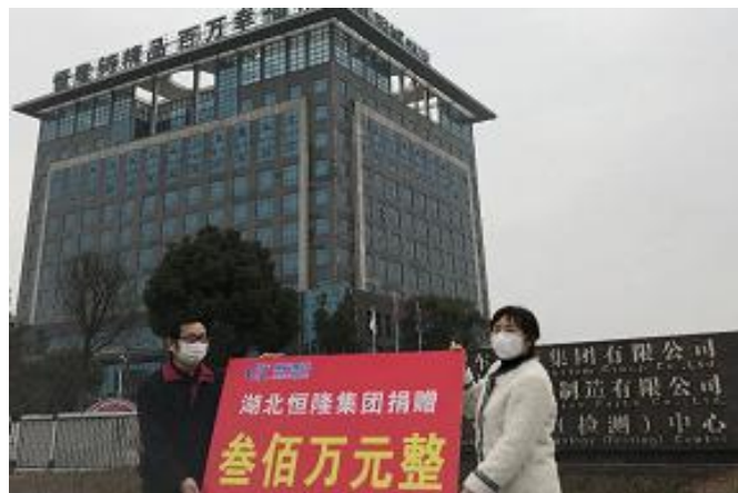
图 1 恒隆集团捐赠款项支持抗击疫情

湖北恒隆集团： 为协助湖北抗击新冠肺炎疫情，恒隆集团向荆州市慈善总会捐赠 300 万元，与荆州父老、湖北乡亲风雨同舟，共克时艰。疫情期间，集团党委模范带头，开展慰问孤寡老人的爱心传递活动，体现了组织对困难群众的关怀和保护，弘扬党的优良传统，传播社会正能量。