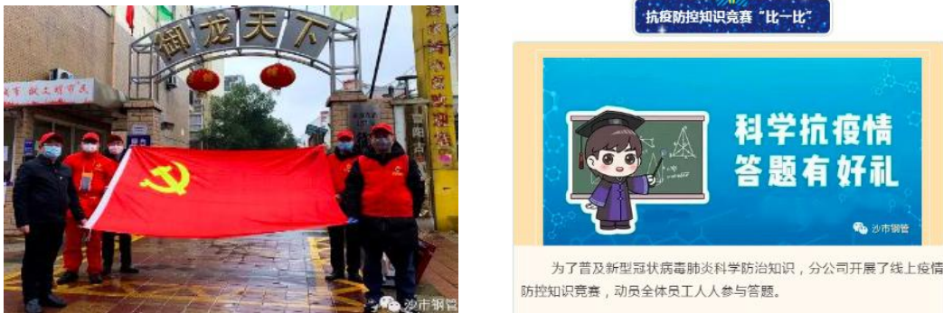
图 4 沙市钢管分公司支援社区，科普抗疫情知识

国网湖北电力： 荆州的疫情防控形势严峻，保电工作尤为重要。湖北电力人持续坚守，面对疫情，不畏艰难，坚守岗位，巡视线路、紧急检修抢修，保障全市人民供电，紧急为战时医院、防疫点解决照明问题，对政府、定点医院、疾控中心等重要场所的线路和用电设备进行特巡和上门服务，为打赢防疫攻坚战提供了可靠的供电保障，为荆州人民守卫光明，守卫希望。