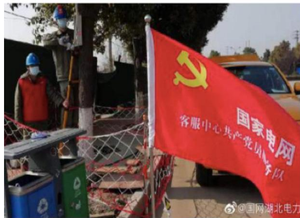
图 5 荆州电力人坚守奋战一线

国网湖北电力： 荆州的疫情防控形势严峻，保电工作尤为重要。湖北电力人持续坚守，面对疫情，不畏艰难，坚守岗位，巡视线路、紧急检修抢修，保障全市人民供电，紧急为战时医院、防疫点解决照明问题，对政府、定点医院、疾控中心等重要场所的线路和用电设备进行特巡和上门服务，为打赢防疫攻坚战提供了可靠的供电保障，为荆州人民守卫光明，守卫希望。