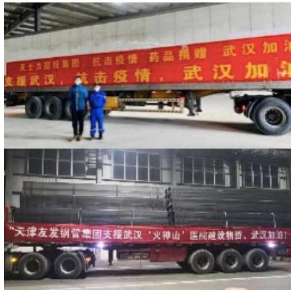
图 1 天津企业支援抗击疫情

疫情当前，天津企业第一时间伸出援手，友发钢管加班加点生产，短时高效全力保障火神山、雷神山医院建设钢管需要，天士力药业捐助超过 1000 万药品，天津荣钢捐款 1 亿元，并联系 150 万元防疫物资支援武汉，天地伟业数码科技开发远程庭审系统支持随州曾都区人民法院“线上”庭审，降低疫情传播风险等，以实际行动彰显社会责任。