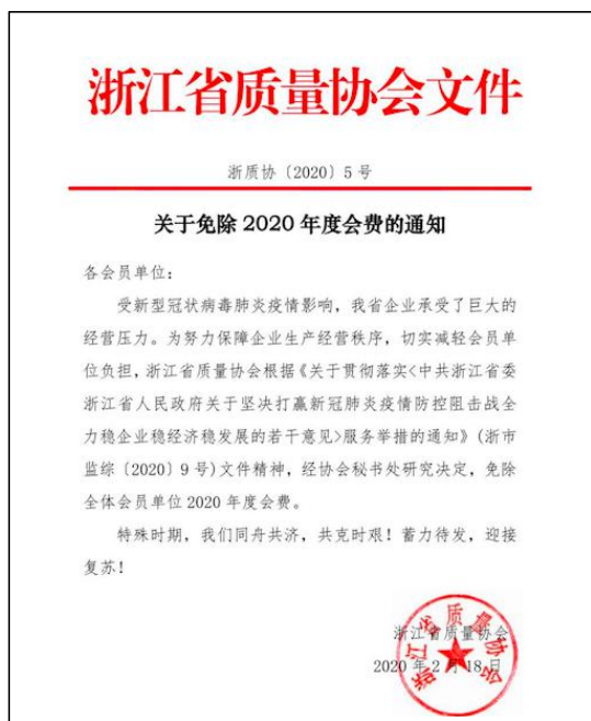
图 3 浙江质协免除企业 2020 年度会费

三是履行社会责任，为会员单位切实减负。为努力保障企业生产经营秩序，切实减轻会员单位负担，协会研究决定免除全体会员单位 2020 年度会费，已缴纳的 2020 年会费顺延为下一年度会费。