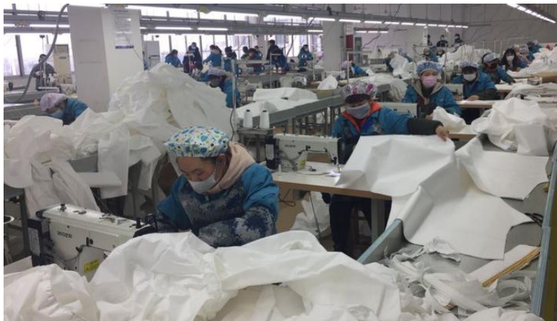
图 2 际华 3521 全力保产，支援一线