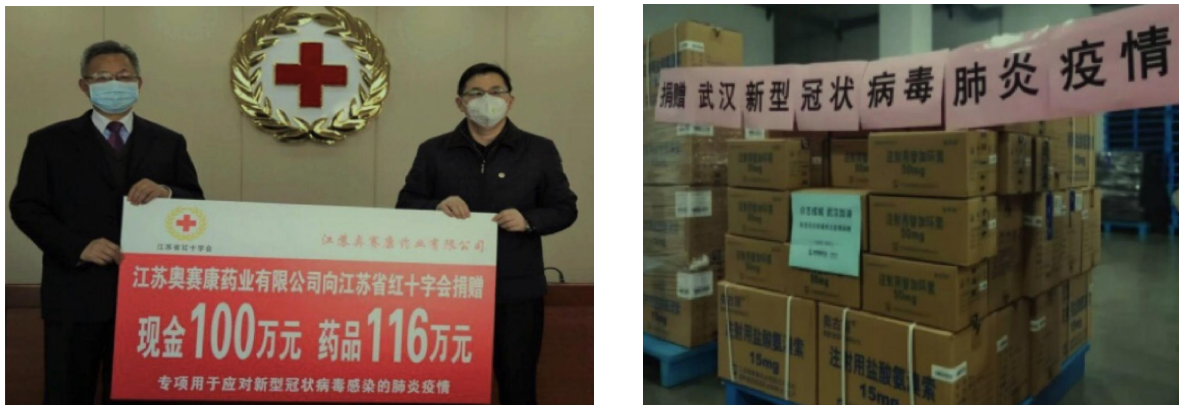
图 3 奥赛康药业捐赠现金及药品

江苏奥赛康药业向江苏省红十字会捐赠现金 100 万元，药品 116 万元，向贵州省红十字会运送价值 10 万余元的防治药品。