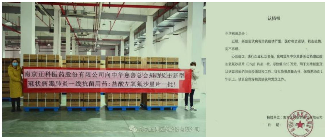
图 4 正科医药捐赠抗击疫情药品

扬子江药业南京海陵药业公司紧急调拨 20 箱抗病毒药物支援常驻武汉某部队, 并全力保生产, 配合党和政府做好后方支援工作。